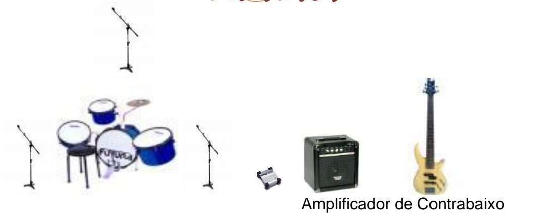
Retorno p/ percussão